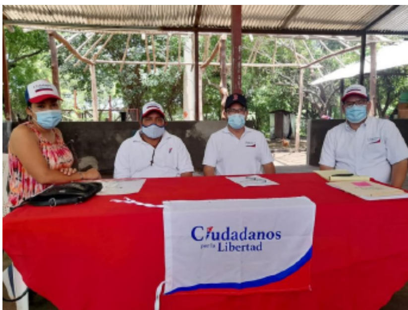
Dirigentes de Ciudadanos por la Libertad