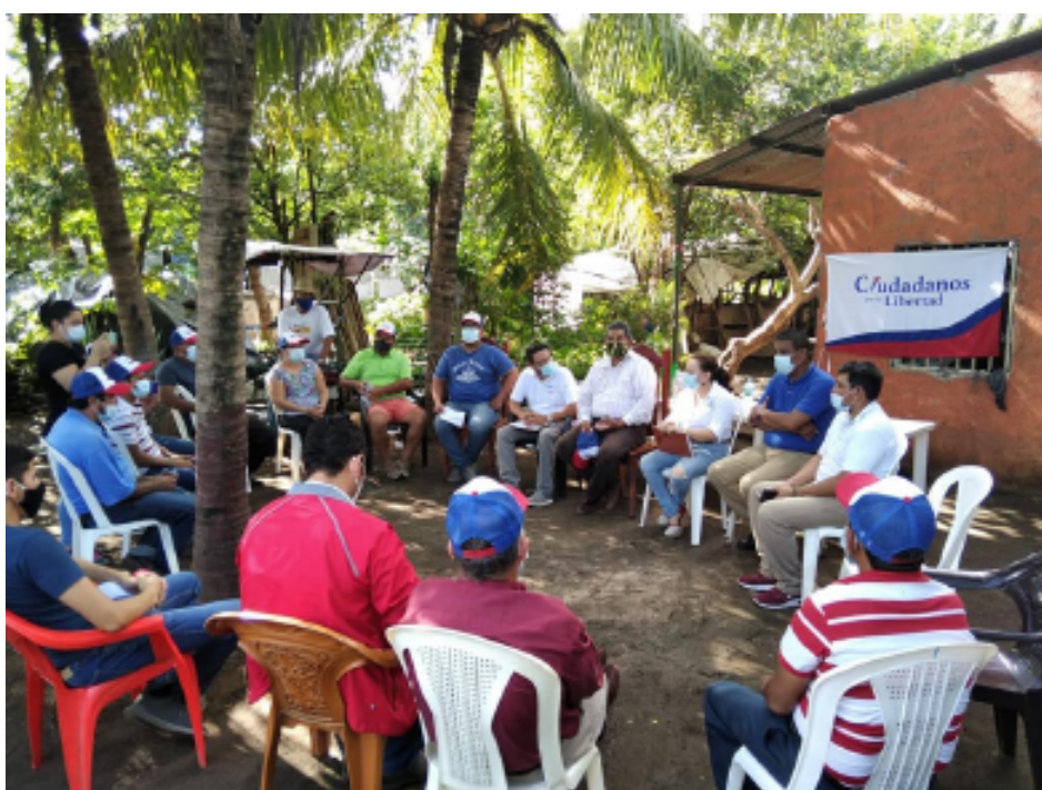
Líderes de Ciudadanos por la Libertad de Tipitapa

Dirigentes de Ciudadanos por la Libertad del municipio de Tipitapa sostuvieron un encuentro con el Fiscal Nacional, Augusto Valle, y con autoridades departamentales, para evaluar el avance del fortalecimiento territorial y proceso de afiliación masiva que se está realizando en los barrios, comarcas y comunidades.