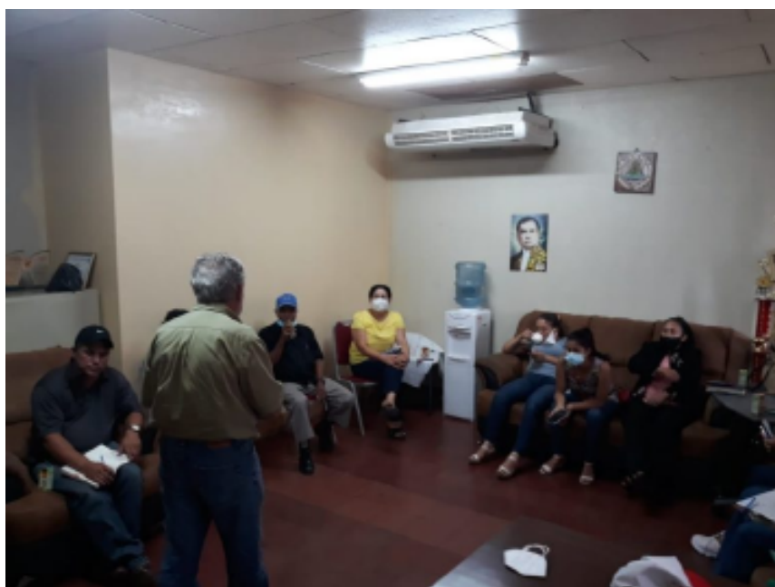
Líderes de CxL Jinotega reunidos en San Sebastián de Yalí

La Junta Directiva Departamental de Jinotega, del partido opositor Ciudadanos por la Libertad (CxL), visitó, el 3 de septiembre, el municipio norteño de San Sebastián de Yalí, a fin de sostener un encuentro con los directivos municipales, para intercambiar experiencias en el trabajo organizativo.