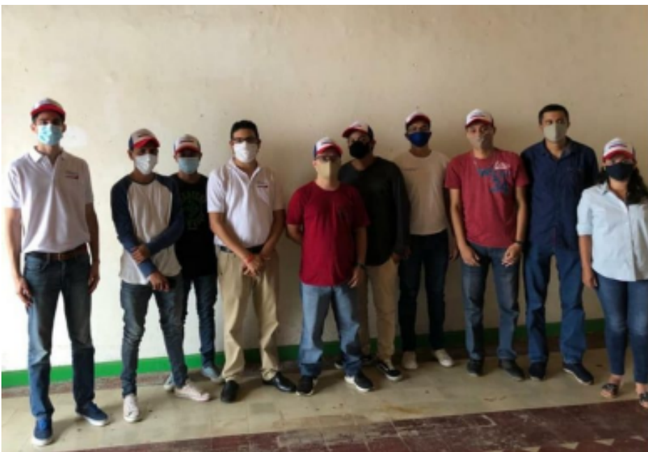
Jóvenes por la Libertad de Rivas.

Granada y Rivas son los primeros departamentos que visitaron dirigentes de Jóvenes por la Libertad (JxL), como parte de una gira que los llevará a recorrer todo el país, para fortalecer la presencia de la juventud en las estructuras del partido opositor Ciudadanos por la Libertad (CxL).