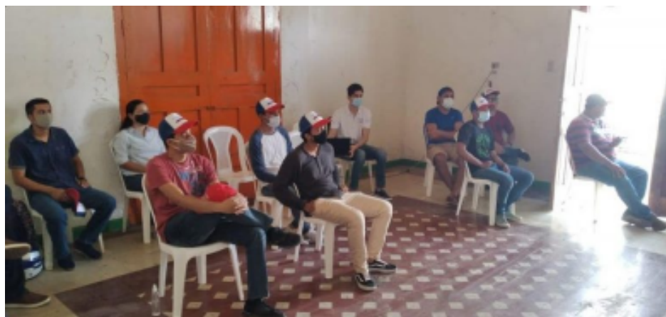
Coordinadores Departamentales de JxL reciben inducción.