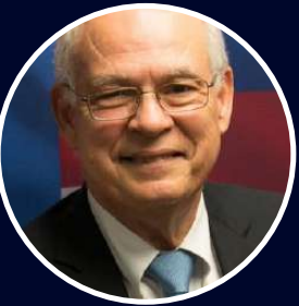
Por: Pedro Joaquín Chamorro