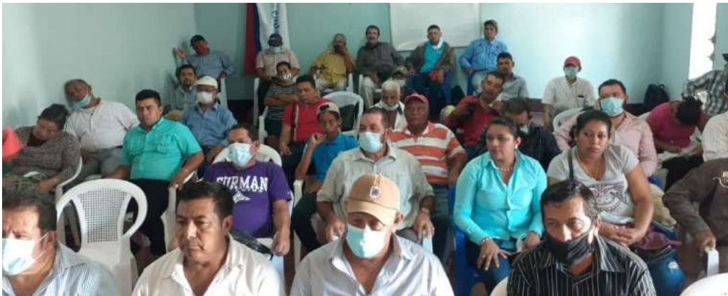
Líderes de los municipios de Chontales en reunión evaluativa de CxL

El encuentro evaluativo de directivos de Ciudadanos por la Libertad del departamento de Juigalpa Chontales, fue asediado por efectivos de la policía sandinista que se dedicaron a requisar a los miembros de esta organización política que se reunieron en la casa departamental.