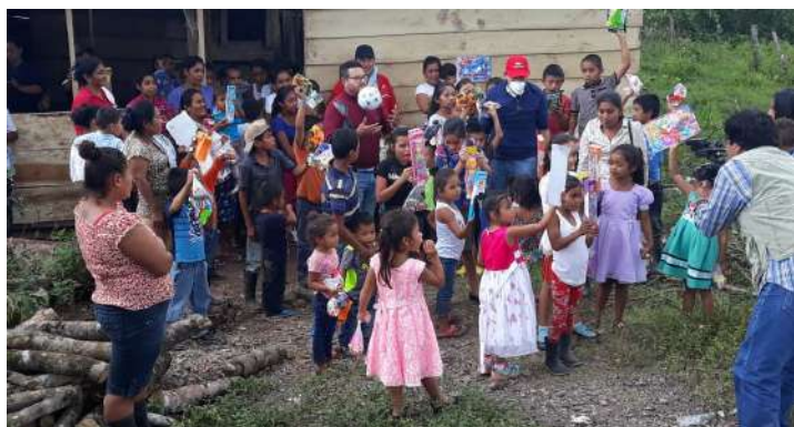
Caribe Norte de Nicaragua

“Hubiéramos querido tener para todos los niños y eso es imposible pero ya al menos esos 5,000 juguetes llegaron a las zonas más pobres, a las más afectadas por los huracanes e impresiona llegar y ver a los niños asombrados, incluso algunos con lágrimas en los ojos, otros con sonrisa, porque había de todo, pero alegres, al fin y al cabo, nos acordamos de ellos, porque los adultos generalmente en situaciones de las que estamos pasando en Nicaragua pensamos primero en la comida, pensamos en el techo que perdieron, pero los niños no piensan en eso y la ilusión de ver eso reflejado en su rostro por lo menos en alguna medida Dios está arriba velando por nosotros”, reiteró Monterrey.