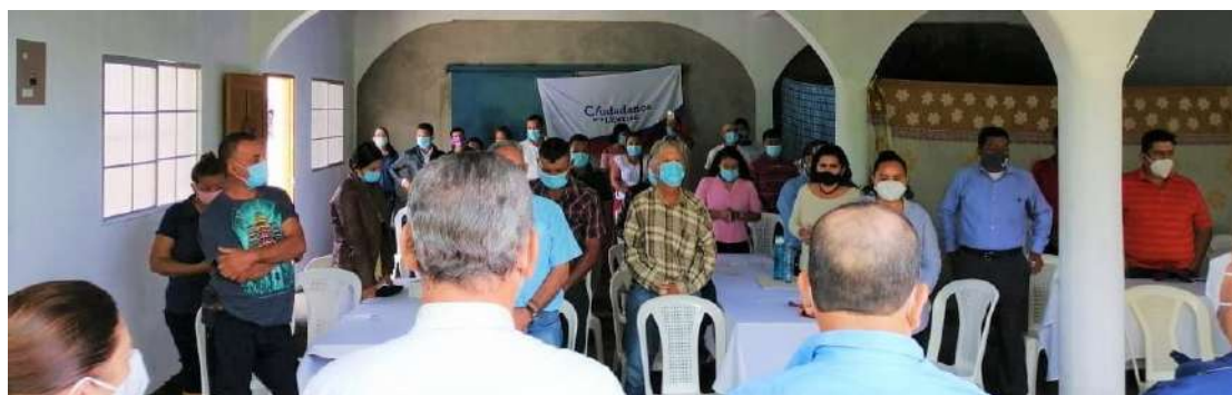
Directivos de CxL Matagalpa

Una vez más el departamento de Matagalpa demostró su fortaleza y organización territorial dentro de las estructuras de nuestro Partido opositor Ciudadanos por la Libertad, al reunir en su asamblea evaluativa de fin de año a todas sus juntas directivas.