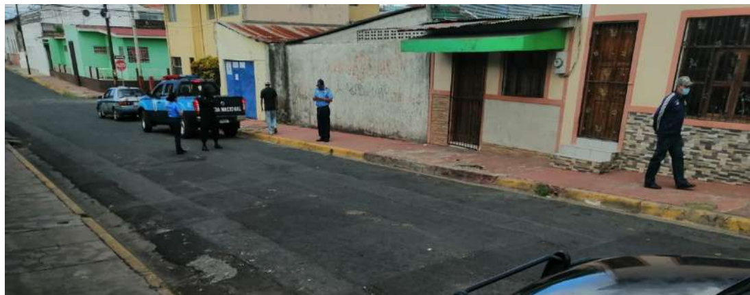
Policía sandinista asedia a líderes de CxL

La policía sandinista se apostó en las afueras de la casa departamental de Ciudadanos por la Libertad de Carazo, pero este acto de intimidación no impidió que nuestros líderes territoriales participaran de su asamblea evaluativa de fin de año, donde valoran de positivo todo el trabajo organizativo.