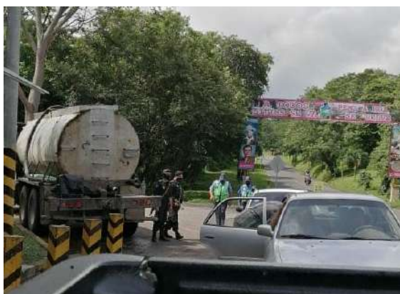
Jóvenes por la Libertad retenidos en Boaco

Considera que dentro de la lucha por restaurar la libertad de Nicaragua todos los sectores son importante, pero recalca que la juventud con su despertar en la lucha cívica de abril del 2018 se convirtió en una esperanza para este pueblo.