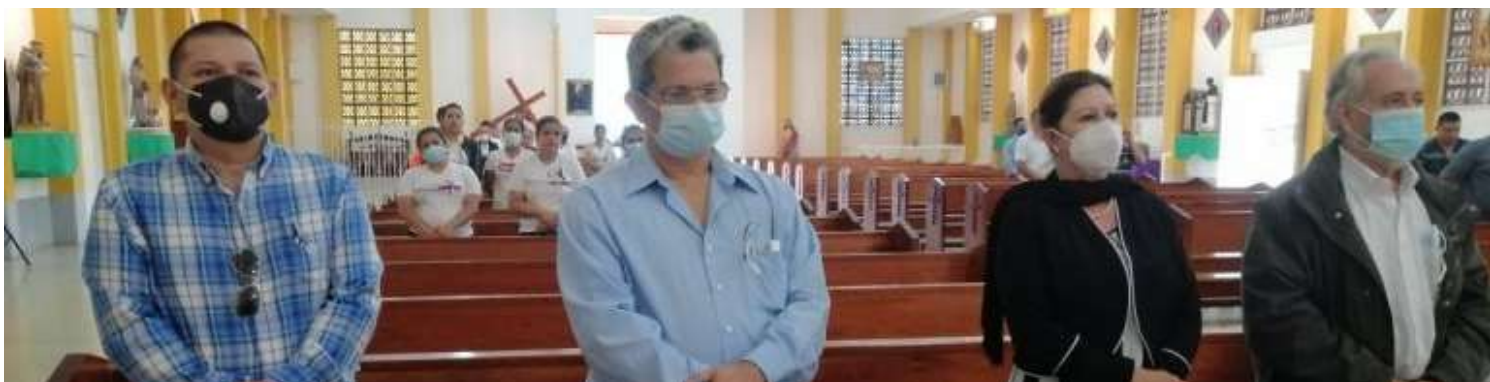
Directivos Nacionales y Departamentales de CxL