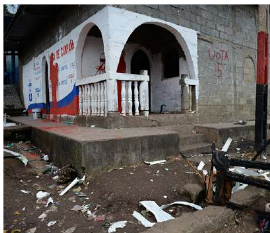
Sandinistas atacaron Casa de Campaña CxL

El asesinato de los jóvenes ocurrió la madrugada del 6 de noviembre, cuando se encontraban en la casa de campaña de Ciudadanos por la Libertad, esperando el escrutinio final de los resultados electorales y de repente fueron atacados por simpatizantes del partido sandinista con armas y morteros.