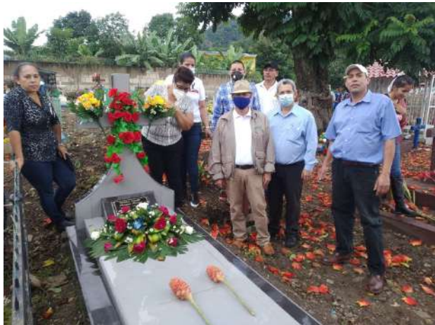
Directivos de CxL depositan ofrenda floral

Luego de concluir la eucaristía familiares y miembros de Ciudadanos por la Libertad se dirigieron al cementerio municipal a depositar una ofrenda floral en las bóvedas de los dos mártires de la Libertad.