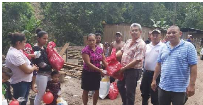
Entrega de donaciones en San José de Bocay.

La ayuda de los paquetes con productos básicos también llegó a las familias afectadas de varias comunidades de los municipios de Santa María de Pantasma, San José de Bocay, San Sebastián de Yalí, El Cuá, quienes perdieron los techos de sus viviendas como producto de las fuertes ráfagas de vientos y quienes vieron destruidas e inundadas sus casas por la crecida de los ríos.