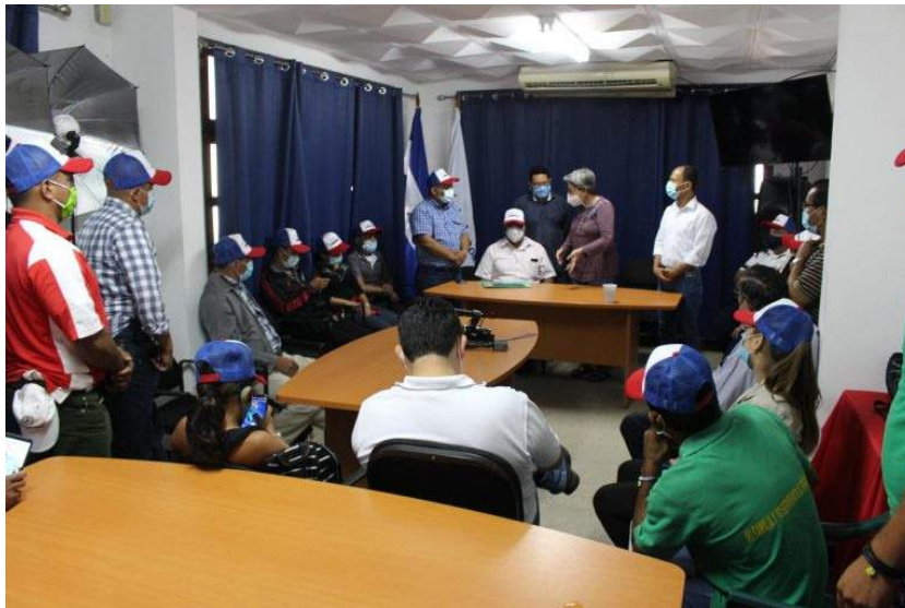
Líderes de Ciudadanos por la Libertad.

Una de las preocupaciones que plantearon los líderes territoriales a las autoridades nacionales de Ciudadanos por la Libertad, fue la cantidad de cédulas vencidas que existen en la población demócrata y la falta de este documento de identidad en los jóvenes que la solicitan por primera vez.