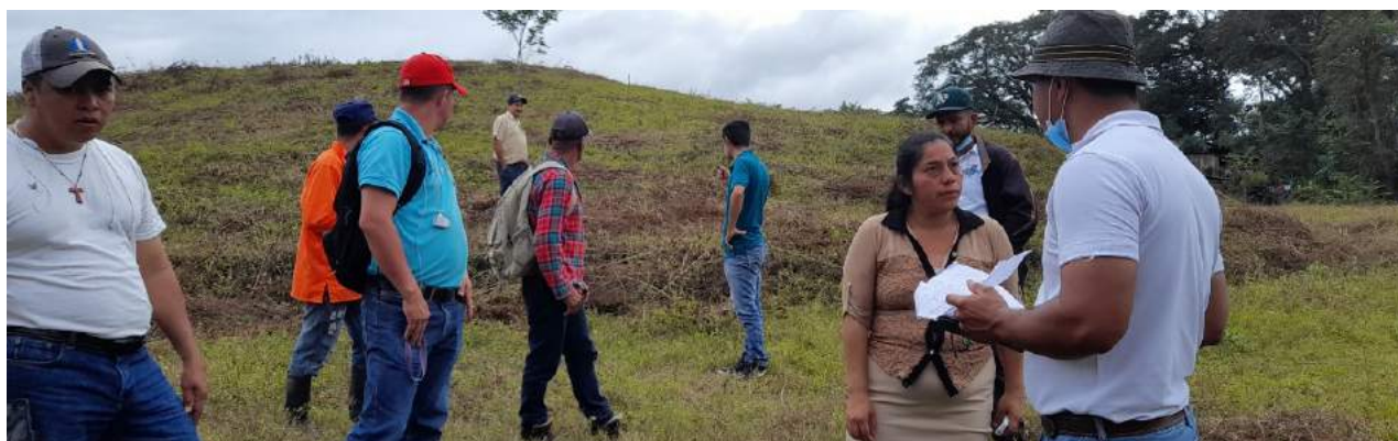
Reparación de calle en El Cuá.