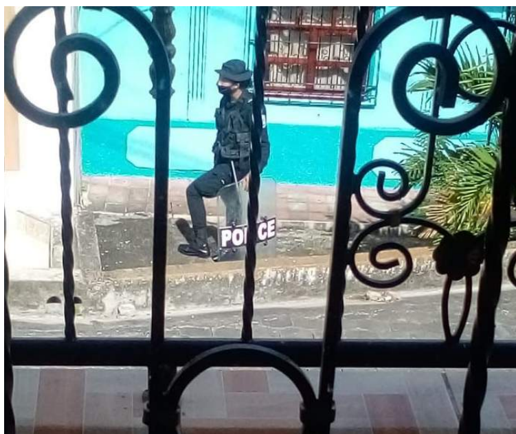
Asedio policial en Boaco.