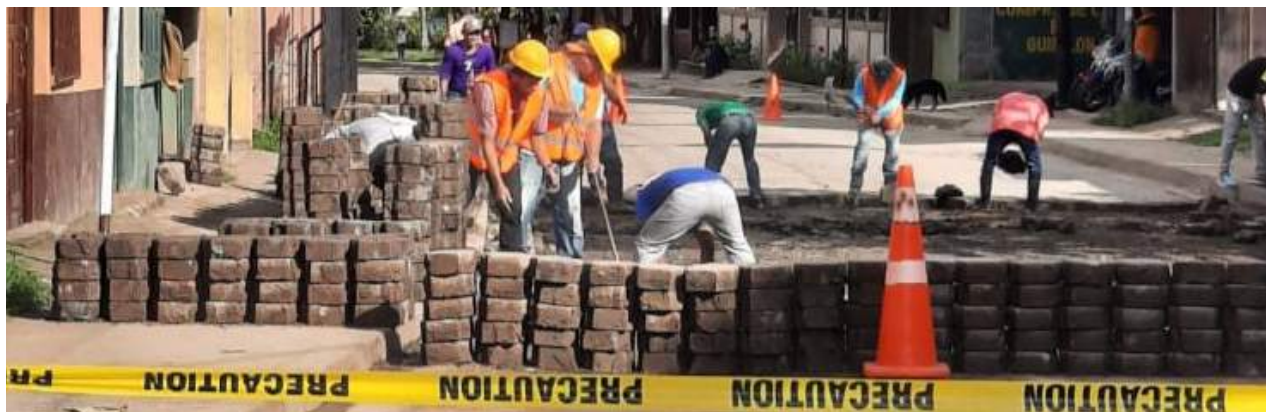
Reparación de calle en El Cuá.

Con una inversión que supera el millón de córdobas la Alcaldía Ciudadana de El Cuá inició la reparación de la calle central del municipio con 300 metros de adoquinado.