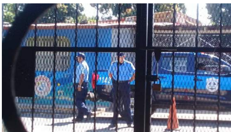
Asedio policial a líderes de Managua.